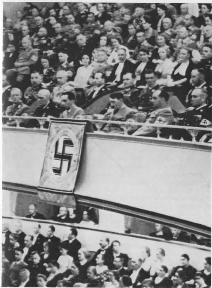
Im neuen Theater