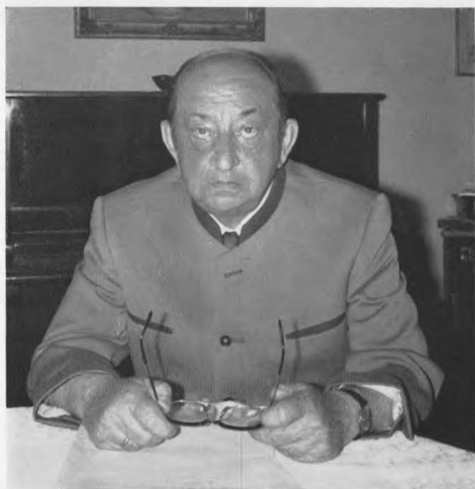
Nach Abschluß der Niederschrift von „Erlebt und erlitten“