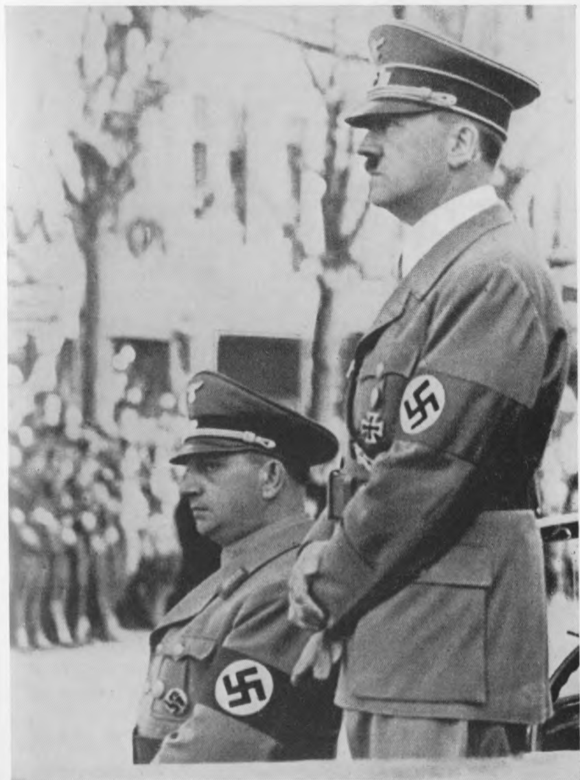
Dessau, 29. Mai 1938